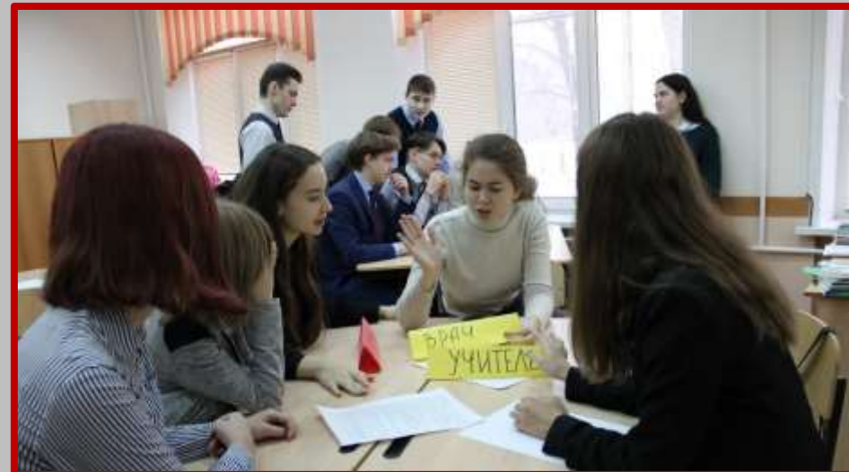
Участники рынка труда